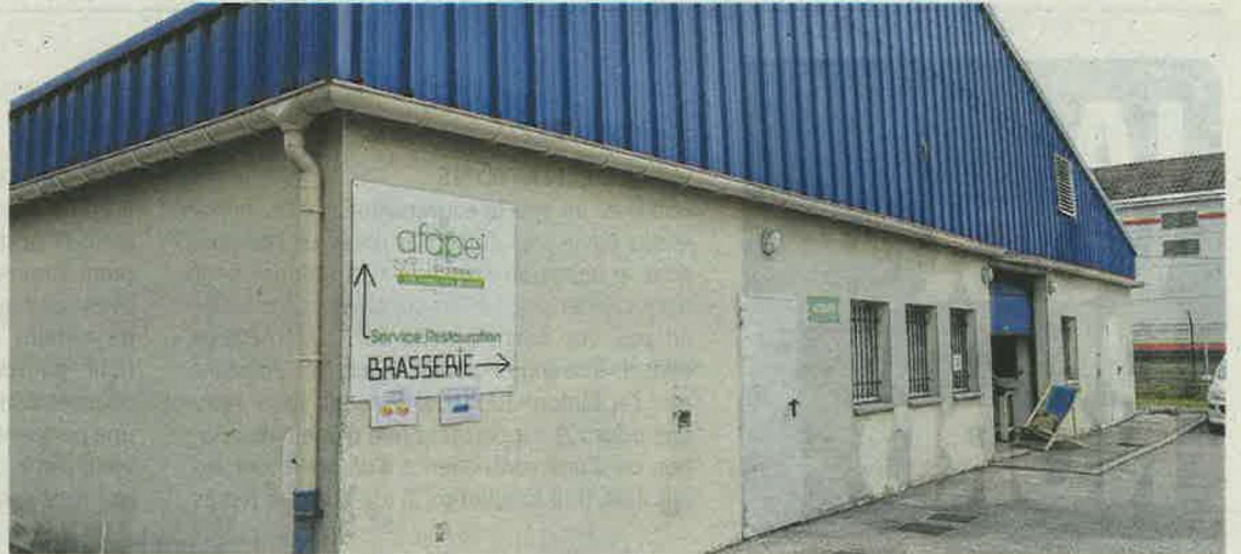
Les bières sont mises en vente depuis un an mais l'inauguration a eu lieu vendredi.